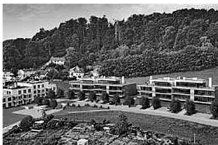
Neherstieg Zum Beispiel am Neherstieg ...