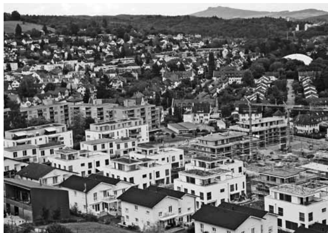
Im Gleichschritt mit den Neubauten verkleinert sich der Grünraum.

Die starke Durchgrünung des Quartiers und die grossen Flächen, die von Sportlern und der Jugend genutzt werden und schon immer als typische Merkmale der Breite gegolten haben, werden durch den Investitionsdruck zerstückelt. Mit dem Verkauf des Familiengartenareals zwischen Breiteschulhaus und Zeughaus sollen rund 5 Millionen Franken in die Stadtkasse fliessen, womit dann das Hallenprojekt im Mühletal finanziert werden soll.