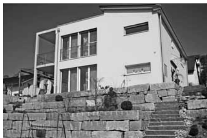
Albisstrasse ... an der Albisstrasse ...