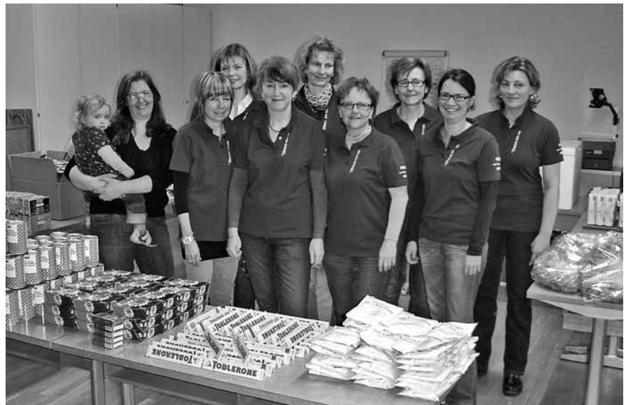
Das «Tischlein deck dich»-Team: