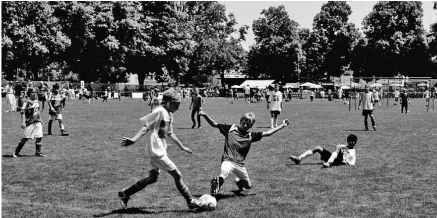
Mit der Sanierung wird die Attraktivität der Anlagen für die Quartierbevölkerung und für die Fussballer markant erhöht.

Am 29. August 2010 hat die Schaffhauser Bevölkerung den Kredit für den Bau des ersten Kunstrasenplatzes im Kanton und in der Stadt Schaffhausen angenommen. Gleichzeitig kann die Bühlsportanlage saniert werden.