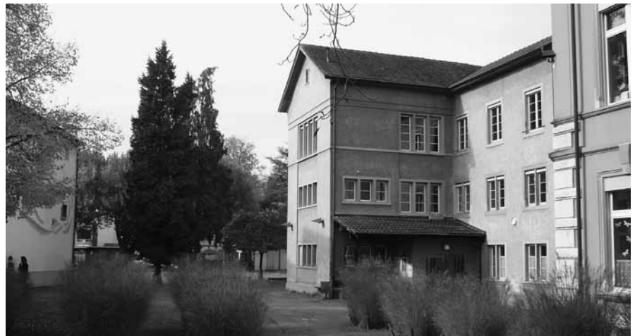
Das «rote» Haus (ganz rechts) wurde 1892 eingeweiht, das «beige» (Mitte) aber schon 1709; es ist eines der ältesten Schulhäuser der Schweiz, in welchen seit der Eröffnung bis zum heutigen Tag Schule gehalten wird.

Das traurige Schicksal der vielen Tagelöhner- und Rebleutekinder auf der Breite, im Mühlental, im Urwerf und in der Neustadt, die ohne Schulbildung und genügende Aufsicht aufwachsen mussten, berührte Pfarrer Hurter sehr.