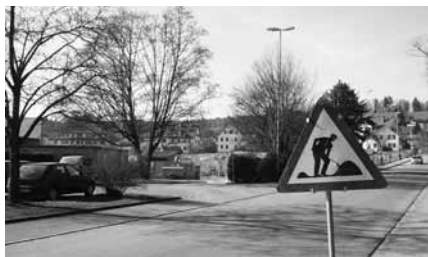
Bauarbeiten an der Breitenaustrasse

Seit Anfang März laufen die Arbeiten für die Sanierung der KSS-Eissportanlagen. Zuerst erfolgte der Abbruch der Ende 1985 gebauten Halle, die eigentlich nur ein acht-jähriges Provisorium hätte sein sollen. Die Wiedereröffnung ist im Oktober geplant. Ein Generalunternehmen übernimmt für die Stadt die Aufgabe, den Bau der neuen Halle zu koordinieren. Die neuen Garderoben, die Curling- und die Eishalle sollen im Herbst schon wieder betriebsbereit sein. Beunruhigt kritisierten bei Baubeginn lokale Gewerbebetriebe die Bauherrschaft, weil das zuständige Generalunternehmen die Vergabe der Aufträge kurzfristig und preisdrückend vorgenommen habe. Hoffentlich erhalten bei der Vergabe der Aufträge viele einheimische Betriebe die Chance mitzuwirken.