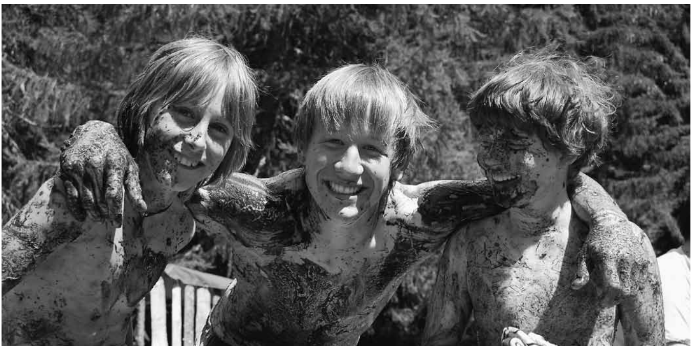
Als JuBla-Highlight des Jahres gilt unser zweiwöchiges Sommerlager. Dank dem kreativen Lagerthema wird das Zelllager zu einem aufregenden und unvergesslichen Erlebnis.