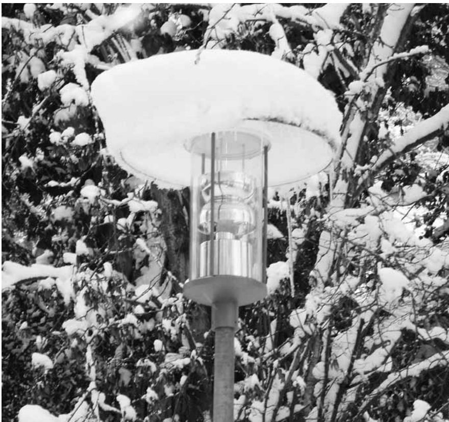
Unter dem Aspekt einer Reduktion der Lichtemissionen wurden bereits sämtliche Kugel-leuchten durch neue Parkleuchten ersetzt. Im Rahmen des ordentlichen Unterhalts werden die bauchigen Wannengläser der Strassenleuchten gegen neue Flachgläser ausgetauscht.

Noch offen ist der Punkt Teilabschaltungen, wie sie in andern Gemeinden (z.B. Winterthur, Wetzikon usw.), zum Teil auch im Quartier Buchthalen sowie in Hemmental, bereits eingeführt worden sind. Der Stadtrat hat beschlossen, für diese Massnahme jeweils die Meinung der Quartiere einzuholen. Demnächst soll ein Vorschlag der Städtischen Werke für das Quartier Breite vorliegen. Der Termin der Präsentation über das gesamte städtische Lichtkonzept sowie die geplanten Massnahmen im Quartier Breite stehen noch nicht fest. Der Termin wird, sobald er bekannt ist, auf der Website www.qvbreite.ch unter Veranstaltungen bekannt gegeben. Er kann auch beim Stadtökologen Urs Capaul in Erfahrung gebracht werden.