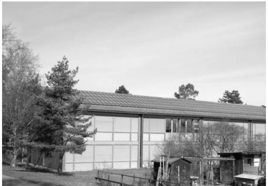
Der Stadtrat hat die Absicht, einen Erweiterungsbau auf der architektonischen Basis des Neubaus von 1985 zu erstellen.

Vor diesem Hintergrund erstellte das Schulreferat in einem ersten Schritt eine Bestandsaufnahme der vorhandenen Schulräumlichkeiten und leitete daraus den künftigen Bedarf ab. In die Überlegungen einbezogen wurde die Einrichtung von Räumlichkeiten für Gruppenarbeiten, für verschiedene Formen von Einzelunterricht, für Medien und nicht zuletzt für die Tagesbetreuung. Mit den Erhebungen des Schulreferates klärte das Baureferat für jede Schulanlage die Machbarkeit der vorgesehenen baulichen Massnahmen ab und ermittelte die daraus resultierenden Kosten.