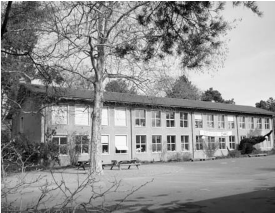
Der Altbau aus dem Jahr 1953 ist sanierungsbedürftig. Sollen Neuzuzüger auf die Breite ziehen, muss auch die Schulsituation stimmen.

Für das Breitequartier schlägt der Stadtrat dem Grossen Stadtrat die notwendige Sanierung des Altbaus und einen modular realisierbaren Erweiterungsbau vor. Dieser soll 4 bis 6 Klassenzimmer, einen Mehrzweckraum und neue Werkräume enthalten und wenn möglich auf der architektonischen Basis des 1985 erstellten Erweiterungsbaus realisiert werden. Sollte sich erweisen, dass der Bedarf zum Führen einer Tagesschule auf der Breite besteht, müssten auch dafür die notwendigen räumlichen Voraussetzungen geschaffen werden.