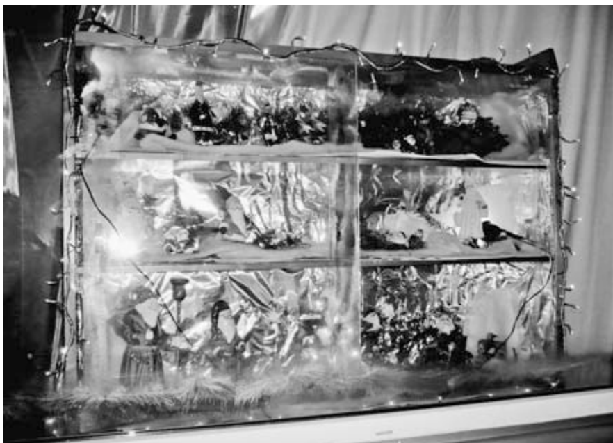
Im Birchfest war ein schönes Adventsfenster mit lauter Samichläusen zu bestaunen.

16.5.2008, Fr., GV Trägerverein, 19.30 Uhr 14.6.2008, Sa., Sommernachtsfest