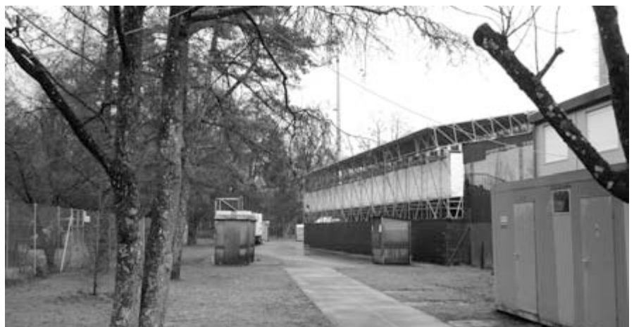
Schule und Vereine vermissen die Aussensportanlage. Sie fristet ein tristes Dasein unter der Stadiontribüne.