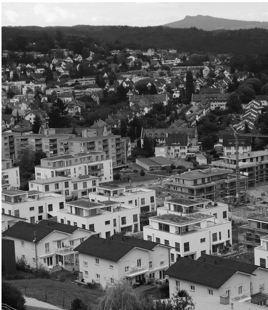
Wo früher Obstbäume blühten, boomt der Wohnungsbau. Das Areal «Sandacker» ist bald vollständig überbaut.

Wir nehmen klar Abstand vom Baurausch PASS, wo mit einem Entscheid 500 bis 800 neue Wohnungen die öffentlichen Grünflächen verdrängen sollen. Der Wohnbau-boom wird ein Ende haben. Versilberte Grünflächen sind für ewige Zeiten der Öffentlichkeit entschunden. Der mögliche Erlös aus dem Landverkauf von bis zu 40 Millionen Franken ist in dreissig Jahren ein Pappentstiel. Nur die unversehrte Verfügbarkeit der Grünflächen ist für die Bürger der nächsten Generation Gold wert.