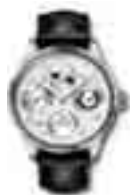
Wer kennt dieses Modell von IWC? www.iwc.ch