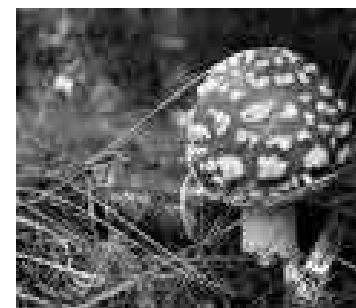
Wer kennt diesen Pilz? Antwort siehe oben.